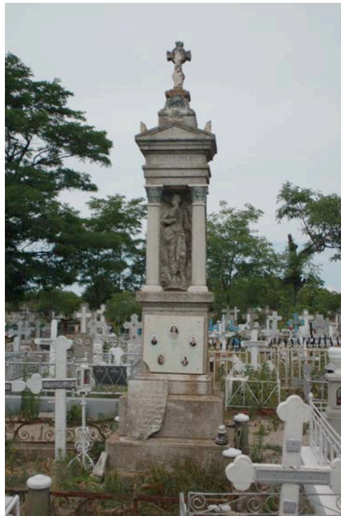
Εικ. 3. Μνημείο Λιτσάτων