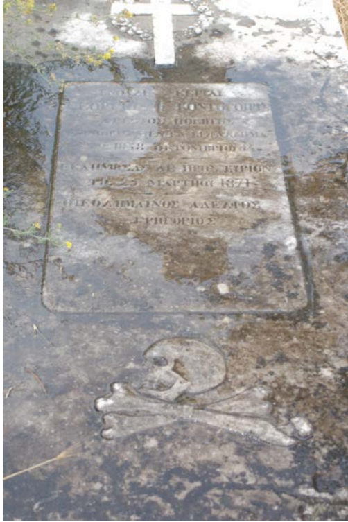
Εικόνα 1. Μνημείο Γ. Κοντογούρη